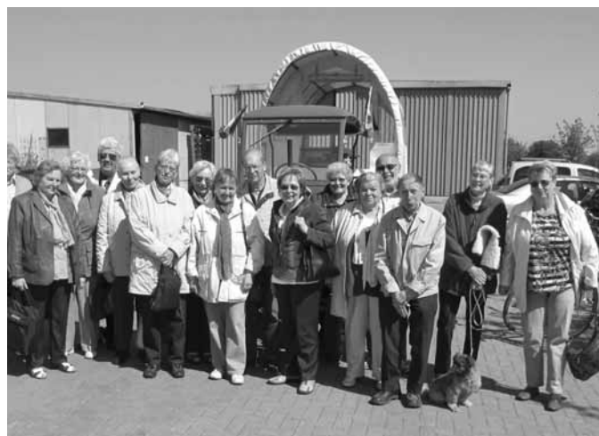
Am 5. Mai verbrachte die Ausflugsgruppe einen schönen Tag auf dem Spargelhof Heuers in Fuhrberg

Wer Zeit hat und interessiert ist, kann sich bei mir unter der Tel.-Nr. 350 49 77 anmelden.