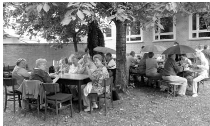
Grillen 2010 in Hainholz

Für Grillgut, Getränke und Brot wird gesorgt. Schön wäre es, wenn einige Salate mitbringen und / oder launige Beiträge für einen lustigen Sommerabend.