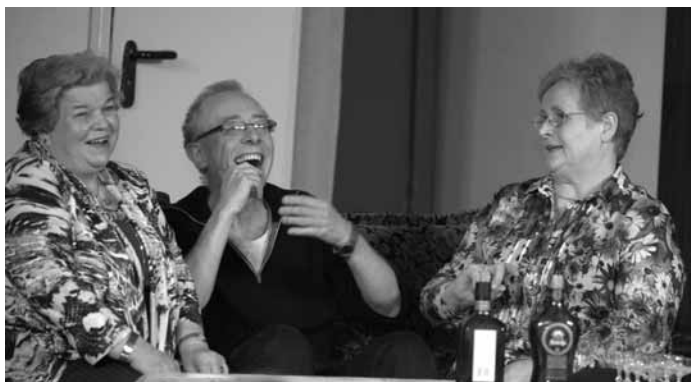
...und unerwartete Verbrüderungen und Verschwisterungen.

Wer übrigens selbst gerne Theater spielen möchte, ist herzlich eingeladen, uns von der Hainhölzer Rampe kennenzulernen und Kontakt mit uns aufzunehmen. Es ist jetzt ein idealer Zeitpunkt zum Einstieg, weil wir derzeit in die Planungen für unser nächstes Stück gehen. Am besten einfach anrufen unter 352 09 10 bei