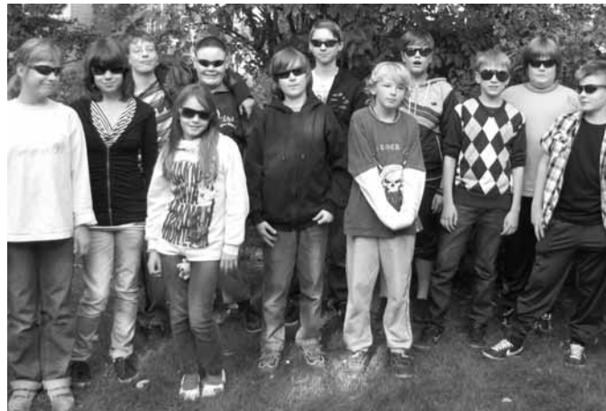
Die Konfirmandenzeit: gibt neue Einblicke...