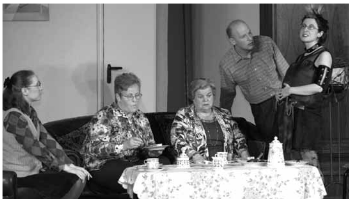
Überraschender Besuch in der Ich-WG...

Die Theatergruppe Hainhölzer-Rampe freut sich über den guten Publikumszuspruch bei den Aufführungen der Komödie „Ich-WG“. Vielen Dank an alle, die uns weiter empfohlen und mit dafür gesorgt haben, dass wir viele Zuschauerinnen und Zuschauer begrüßen konnten. Und natürlich gilt unser besonderer Dank denen, die uns am Licht und Ton, beim Karten- und Getränkeverkauf und in anderer Weise unterstützt haben. Hier einige Impressionen von den Aufführungen, fotografiert von Holger Hütte.