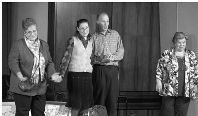
...bis ihre Mütter in die WG einziehen.