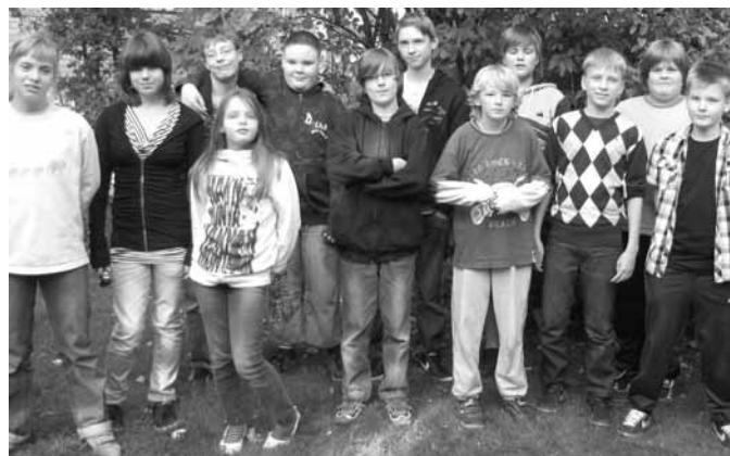
...und eröffnet neue Sichtweisen!