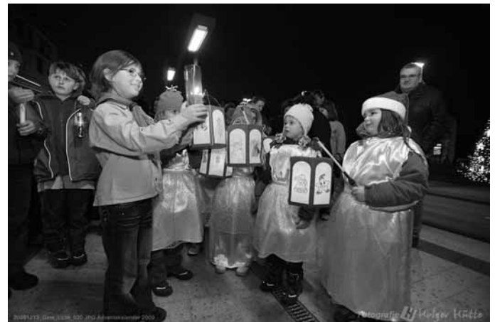
Das Friedenslicht kommt in Hainholz an

Die Idee des Friedenslichtes aus Bethlehem verbreitet sich seit 1986 in ganz Europa. Seit diesem Jahr wird ein Licht in der Geburtsgrotte in Bethlehem entzündet und mit dem Flugzeug nach Wien gebracht. Dort übernehmen Jugendliche aus ganz Europa, oft Mitglieder der PfadfinderInnenbewegung, das Licht und bringen es in ihre Länder. Inzwischen werden über 30 Länder in Europa erreicht.