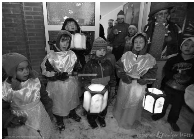
Hainhölzer Engel in Aktion

...ist wieder Advent und in Hainholz der lebendige Adventskalender. Immer um 18 Uhr sind alle eingeladen, sich vor einer anderen Tür im Stadtteil zu treffen, um gemeinsam eine Kalendertür zu öffnen. Das Eröffnen übernehmen Hainhölzer Kinder, die bei den Engel-Treffen auf diese Aufgabe vorbereitet werden.