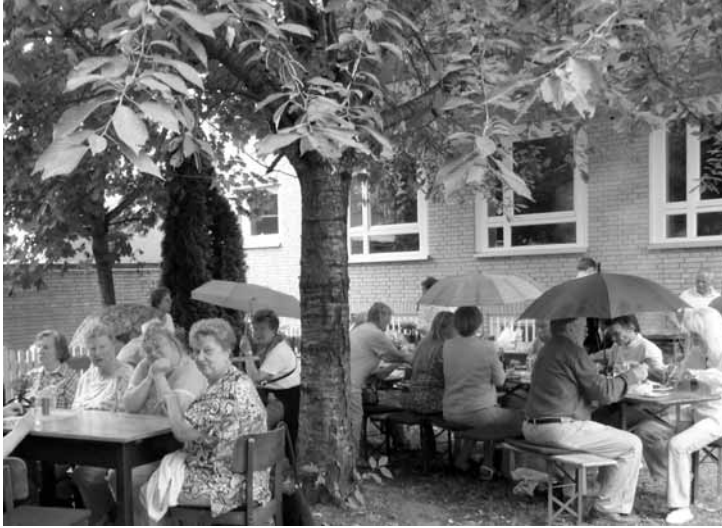
Grillen im Hof: Erstmals gab es im Hof des Gemeindehauses von Hainholz in den Sommerferien ein gemeinsames Grillen als Angebot für Daheimgebliebene. Leider hat das Wetter nicht so mitspielt wie gewünscht, so ging es dann drinnen weiter.