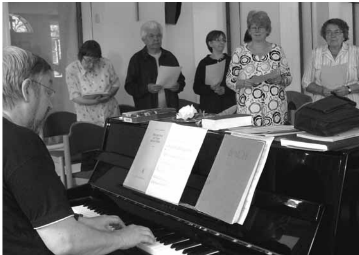
Chorfreizeit: Die Kantorei war ein Wochenende lang in Hermannsburg, um intensiv zu proben. Der gemütliche Teil kam aber auch nicht zu kurz.