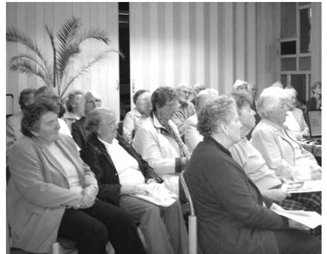
Abend zum Thema Stürze: Um die Vermeidung von Gefahren im Alltag, insbesondere im Alter, ging es bei einer Veranstaltung der Gruppe 50 Plus.