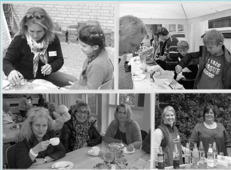
Eindrücke vom Andreasfest